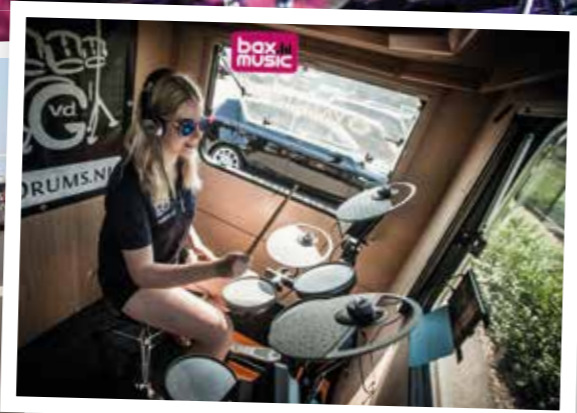
In de Drumcaravan van Leondrums.nl konden de bezoekers even helemaal tot zichzelf komen.