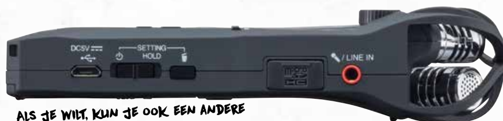
ALS JE WILT, KUN JE OOK EEN ANDERE MICROFOON AANSLUITEN

AANTREKKELIJK De Zoom H1n is buitengewoon aantrekkelijk! Het is een recorder met superhandige bediening en grappige, muzikale faciliteiten én het is een usb-microfoon voor je Mac, pc of iOS-apparaat. De opnameresultaten zijn uitstekend, mits je bij grotere luchtverplaatsingen de juiste voorzorgsmaatregelen neemt. Hij is zó compact en licht dat je 'm nooit hoeft thuis te laten. Jammer dat het geen december is, want voor deze prijs is het een cadeau(t)je van formaat. 🎁