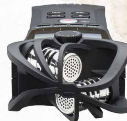
DE STEREO-MICROFOON IS GEPLAATST IN EEN X/Y-OPSTELLING